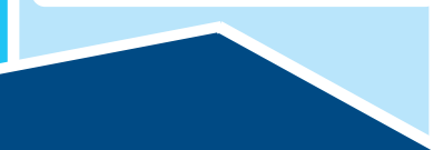
M 1.2 Kfz-Überwachung