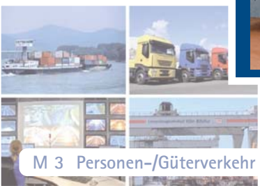
M 3 Personen-/Güterverkehr