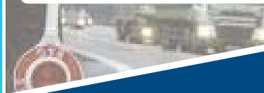
M 1.1 Verkehrsüberwachung