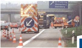
M 1.0 Verkehrsrecht